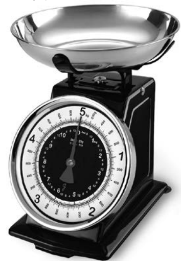
BALANCE DE CUISINE RÉTRO MODE D'EMPLOI